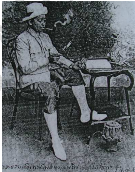
พระบาทสมเด็จพระมงกุฎเกล้าเจ้าอยู่หัว (เมื่อ เมษายน 2452)

พระบาทสมเด็จพระมงกุฎเกล้าเจ้าอยู่หัว เมื่อครั้งดำรงตำแหน่งพระบรมโอรสาธิราช สยามมกุฎราชกุมาร ได้เสด็จประพาสหัวเมืองปักษ์ใต้ เป็นระยะเวลา นานถึง 56 วัน ตั้งแต่วันที่ 8 เมษายน 2452 ถึงวันที่ 31 พฤษภาคม 2452 (ร.ศ. 128) โดยเสด็จออกจากกรุงเทพ ฯ ผ่านและแวะพักแรมจังหวัดต่าง ๆ คือ ชุมพร ระนอง ตะกั่วป่า ภูเก็ต พังงา กระบี่ ตรัง และนครศรีธรรมราช ในการประพาสหัวเมืองปักษ์ใต้ครั้งนี้ พระองค์ได้บันทึกเป็นจดหมายเหตุ ตลอดระยะทางที่เสด็จไปถึง จำนวน 12 ฉบับ โดยใช้นามปากกา “นายแก้ว” www.kuapa.com นำเสนอเฉพาะในส่วนที่เกี่ยวกับตะกั่วป่าและพังงา หากท่านใดมีความประสงค์จะให้ kuapa.com นำเสนอตอนใด โปรด comment