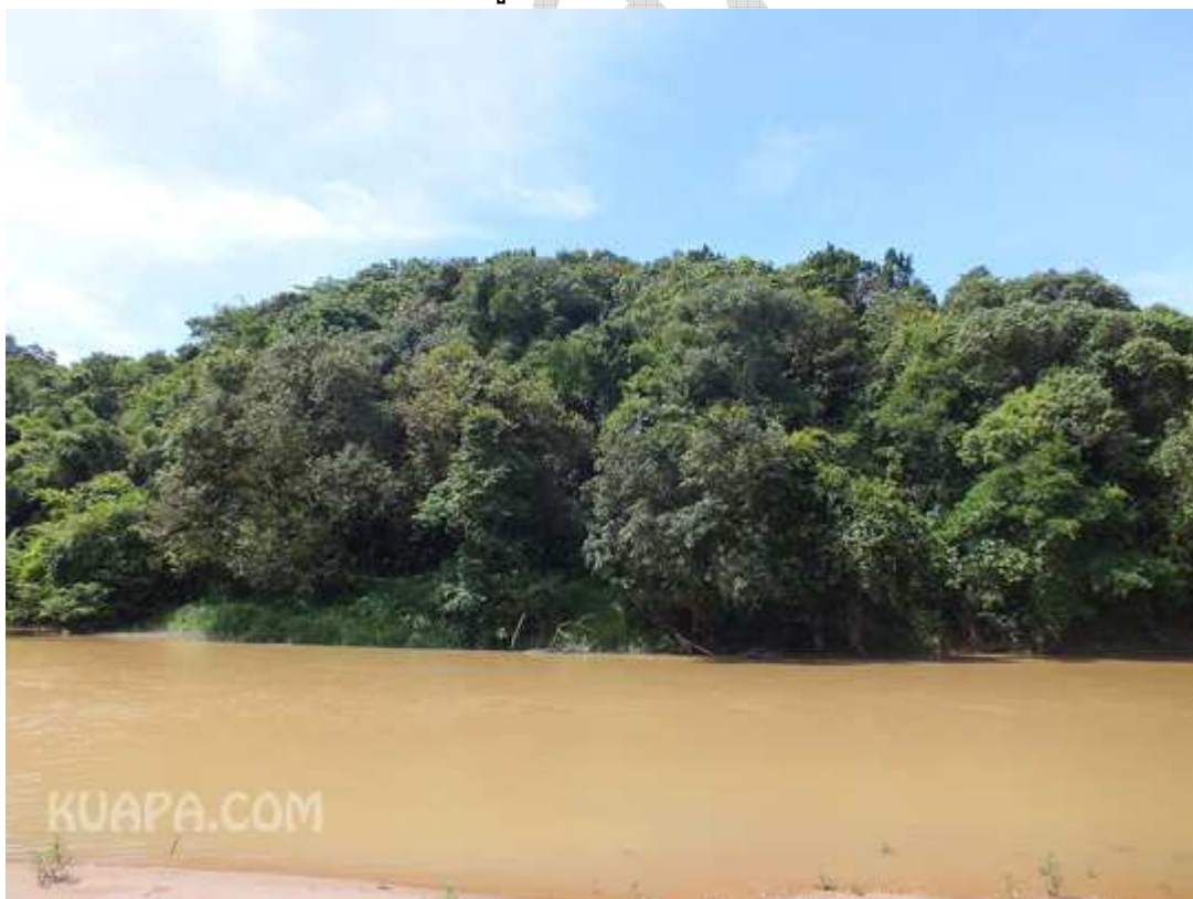
เขาพระนารายณ์ (เขาเวียงในจดหมายเหตุ)

ตามระยะทางที่ไปวันนี้ได้ผ่านหมู่บ้านไปหลายหมู่บ้าน พอถึงบ้านพวกพม่าได้ หยุดพักกินน้ำบ้าง ผมช่างนึกโล่งแทนจริง ๆ เดินไปร้อนเหงื่อโชก ๆ แต่ผมที่หนึ่งไป บนเก้าอี้ยังร้อนพอแรงการทางก็มีใช้ใกล้ จากปลับปลาที่ประทับแรมนี้ไปถึง ปลับปลาประทับร้อนที่เขาเวียงระยะทางถึง ๒๖๗ เส้น ที่ประทับร้อนนี้อยู่ในแขวง อำเภอกะปง นายอำเภอก็ได้ทำปลับปลารับเสด็จเข้าแบบโรงนาอีก เย็นสบายดี มี ผู้คนมากคอยเฝ้ารับเสด็จอยู่มาก กำหนดคนหนึ่งกับผู้ใหญ่บ้านอีก ๒ คน ได้จัดเครื่อง ถวายเป็นของขวัญจะเก่ง กำหนดผู้ใหญ่วบ้านจัดเครื่องถวายไม่มีใครจะเคยพบและพวกที่ตาม เสด็จออกจะพากันหาร ๆ แต่ครั้งไปถึงที่แล้วก็ยังมีเครื่องเลี้ยงจริง แต่ว่าใครจะได้ อุดหนุนบ้างหรือไม่ผมไม่ทราบ กำหนดและผู้ใหญ่วบ้านที่จัดเครื่องนั้น ท่านเจ้าเมืองได้ นำเฝ้า เป็นเงินทั้ง ๓ คน ทำทางดูก็ดี