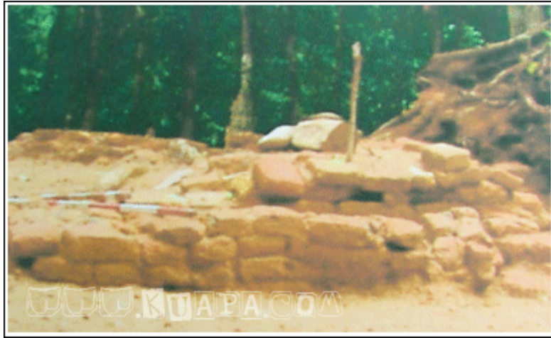
ฐานที่ตั้งองค์พระนารายณ์และเทพบริวารบนเขาพระนารายณ์ (หลังขุดแต่ง ปี 2552)

สิ่งที่สำคัญที่เสด็จไปทอดพระเนตรวันนี้ คือพระนารายณ์เทวรูป ซึ่งตั้งอยู่บนเนินที่ทำพลับพลาประทับร้อน เทวรูปมีอยู่ 3 องค์ เป็นรูปพระนารายณ์ตั้งอยู่กลางข้างขวามือมีเป็นรูปเทพธิดานั่ง ซึ่งบางทีจะเป็นพระลักษมีข้างซ้ายมือมีรูปหนึ่งแปลไม่ออกว่าเป็นรูปพระเป็นองค์เจ้าใด เทวรูปทั้ง 3 นี้ทำด้วยศิลา สลักเครื่องทรงดูเป็นอย่างแบบข้างอินเดียแท้ จึงเข้าใจว่าคงจะเป็นนายช่างช่างฝ่ายมัชฌิมประเทศเป็นผู้ทำ หรืออย่างน้อยก็เป็นผู้ให้อย่าง เพราะฉะนั้นต้องเข้าใจว่าชาวมัชฌิมประเทศได้ออกมาตั้งเป็นคณะอยู่ที่นี้ จะสืบเอาเรื่องราวก็ไม่ได้ก็มากน้อย คงได้ความแต่ว่าเทวรูปนี้เดิมอยู่บนเขาเวียง บนนั้นยังมีฐานก่อด้วยอิฐปรากฏอยู่ ครั้นพม่ามาตีเมืองไทยได้ลงมาที่เขเวียง ยกเทวรูปลงมาได้ถึงที่เนินนี้ ตั้งใจจะนำลงไปทางแม่น้ำ เผอิญเกิดฝนตกลงมาเป็นท่าใหญ่ พม่าจึงต้องทิ้งเทวรูปไว้ หนีเอาตัวรอด และโดยเหตุที่พม่าได้ให้หลังที่ตรงนี้ จึงได้เรียกนามตำบลว่าหลังพม่าต่อมา รูปพระนารายณ์ในเวลานี้ต้นตะแบกได้ขึ้นหุ้มห่อไว้เสียหน่อยหนึ่ง ชะรอยจะมีผู้พิงทิ้งไว้กับต้นตะแบกตั้งแต่ยังอ่อน ๆ ครั้นต้นไม้นั้นโตขึ้นจึงเลยขึ้นหุ้มเทวรูป น่าเสียดายที่สืบข้อความสาวขึ้นไปได้สั้นนัก ที่ริมรูปนั้นมีศิลาแผ่นหนึ่งมีตัวอักษรจารึกแต่อ่านไม่ออกกว่าเป็นหนังสืออะไร ไม่ใช่หนังสือไทย และไม่ใช่หนังสืออย่างที่จารึกคาถาเขรรมมาที่พระปฐมเจดีย์ ศิลาแผ่นนี้ราษฎรถือกันว่าถ้ายกฝนเป็นต้องตก วันนี้คงจะมีใครยกเป็นแน่ เพราะพอเสด็จถึงพลับพลาสักครู่หนึ่งฝนก็ตก อยู่ข้างจะศักดิ์สิทธิ์อยู่บ้าง แต่เพราะไม่มีใครได้พยายามจะยกพระนารายณ์ไป ฝนจึงไม่ตกจนน้ำท่วมอย่างครั้งพม่ายก